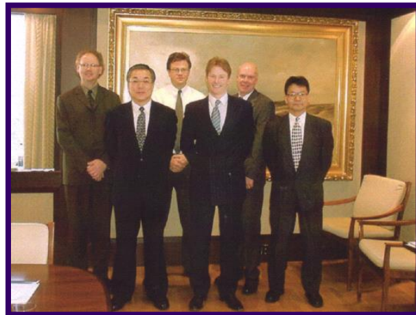
平成14年ノルウェーにて、 JO Tankers 新造船調印式